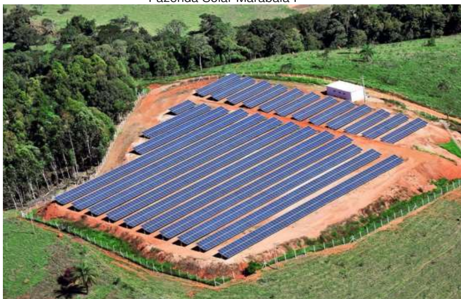
Fazenda Solar Marabaia I

No ano de 2024, houve a transferência de titularidade das contas de iluminação pública para a Brumadinho Ativos, o início das ações de distribuição de energia gerada e a utilização do saldo de crédito e geração acumulado.